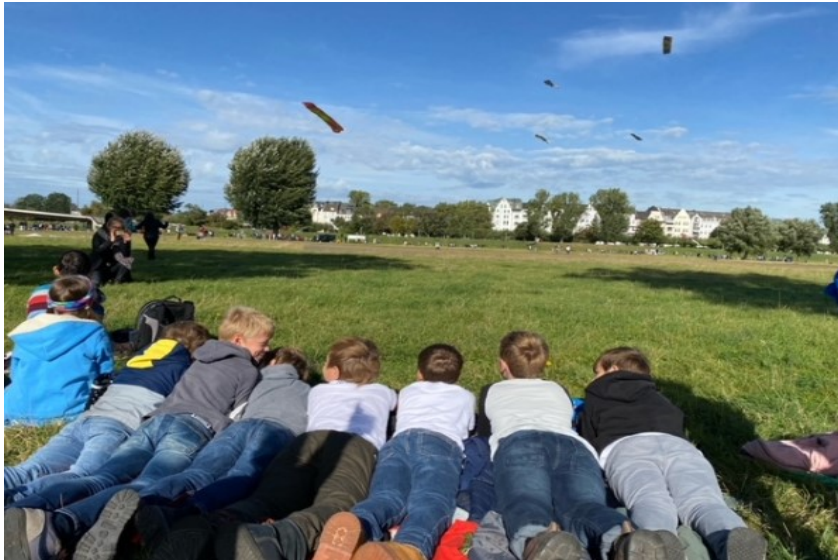
Unsere Viertis mit ihren Bildern am Himmel!

Ein Highlight für die vierten Schuljahre war z.B. das Projekt unter Leitung von Akki (Aktion & Kultur mit Kindern e.V.) Anfang Oktober sah man in Düsseldorf auf der Rheinwiese Oberkassel "Bilder am Himmel", eine fliegende Ausstellung. An vier Tagen bauten und bemalten über 400 Kinder eigene Kreationen in Zusammenarbeit mit Düsseldorfer Künstler*innen, die zum Abschluss als „fliegende Galerie“ präsentiert wurden. Die sechs Drachen zieren mit einer Größe von 8 m x 1,50 m nun nacheinander unser Forum jeweils eine Woche lang.